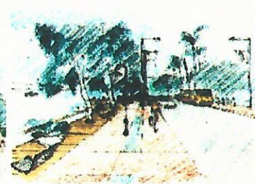
DECK - PASSEIO - CICLOVIA