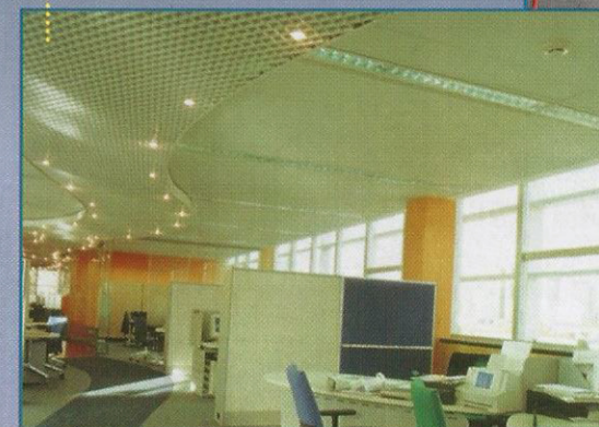
CENTRO BRASILEIRO BRITÂNICO