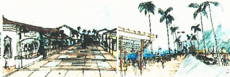
CALÇADÃO - RUA SÃO BENEDITO