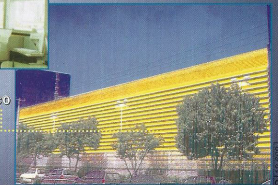
BRISE EM AÇO