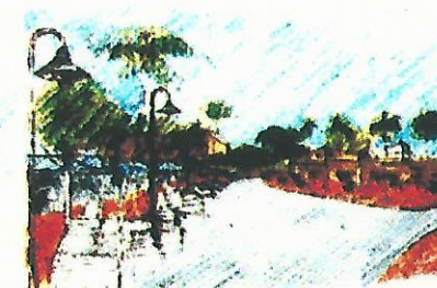
CENTRO COMERCIAL DO PEREQUÊ