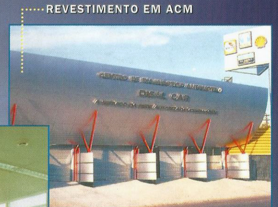
REVESTIMENTO EM ACM