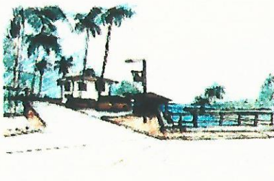
PONTO TERMINAL DE ÔNIBUS / VILA